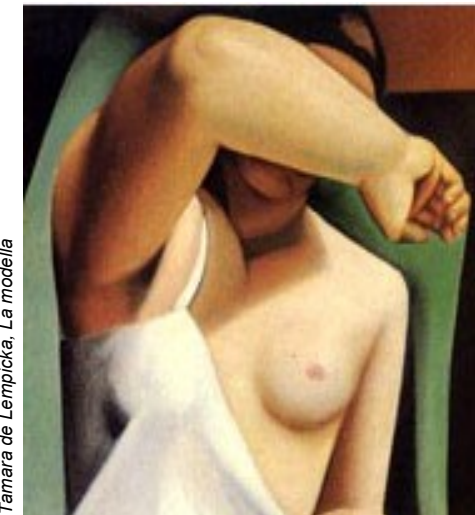
Tamara de Lempicka, La modella

Azioni condivise tra MMG e Specialisti per risultati più efficaci